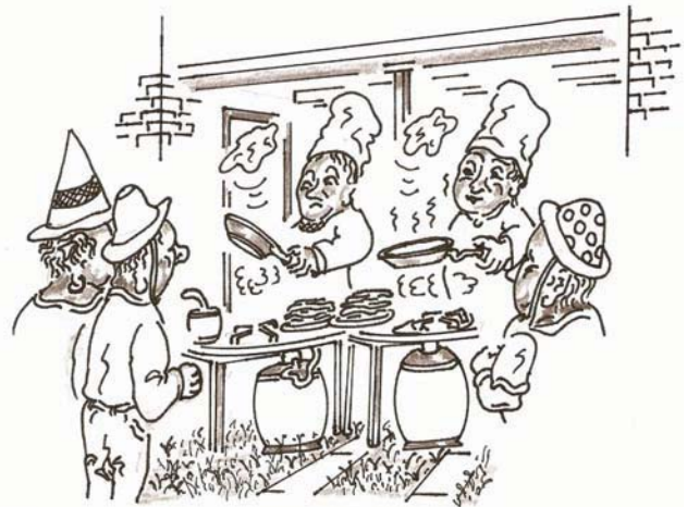
Pannenkoeken bakken in de carport

Tijdens deze middag kunnen de kinderen zich vermaken met o.a. een springkussen, schminken en meedoen met diverse spelletjes. De bedoeling is dat alle kinderen uit de buurt een middag ongeremd en veilig op straat kunnen spelen. Wij proberen er weer een gezellige middag van te maken met veel kinderen en ouders!! Tot 13 juni in de Beukenstraat. Namens Buurtcomité Beukenstraat, Familie Konings en familie Pootjes